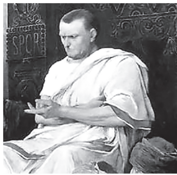
Krisztus Pilátus előtt. A Munkácsy-trilógia 1881-ben befejezett darabja. és fent annak két „főszereplője”