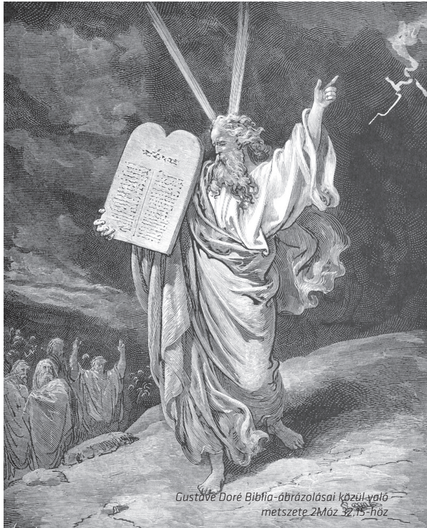
Gustave Doré Biblia-ábrázolásai közül való metszete 2Móz 32,15-höz

A 2. parancsolatból idézett részlettel egybeesengenek Jézus alábbi kijelentései: „ Ha engem szerettek, az én parancsolataimat megtartsátok... Ha valaki szeret engem, megtartja az én beszédemet... ”